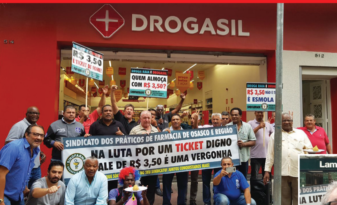
Vários sindicalistas de Osasco e Região estiveram presentes em apoio aos trabalhadores

Bem que poderia ser uma brincadeira de mau gosto, mas não é! As redes farmacêuticas Raia/Drogasil fornecem aos trabalhadores um vale-refeição no valor de R$ 3,50. O benefício já foi apelidado de vale-fome, porque, se bobear, não dá nem para comprar uma coxinha.