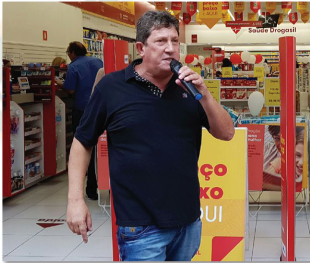
Sindfarmaor: fiscalização para assegurar seus direitos